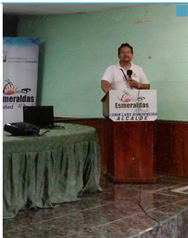
La Delegación Provincial de la Defensoría del Pueblo, trabajó directamente con el Ministerio de Relaciones Exteriores y el GAD Municipal de Esmeraldas en socializar el Rol de la Defensoría del Pueblo en Movilidad Humana.

De esta manera la institución trabaja en el territorio a través de las coordinaciones generales zonales y las delegaciones provinciales, a las que se les ha otorgado las mismas atribuciones y responsabilidades para la tutela y promoción de los derechos humanos y de la naturaleza.